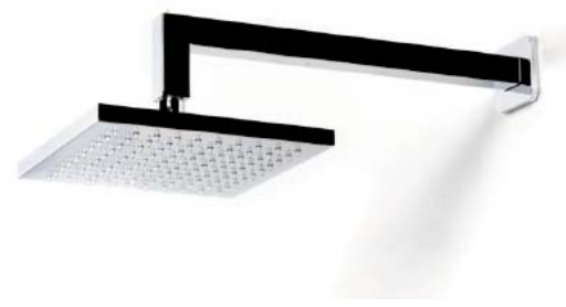
Resto de duchas