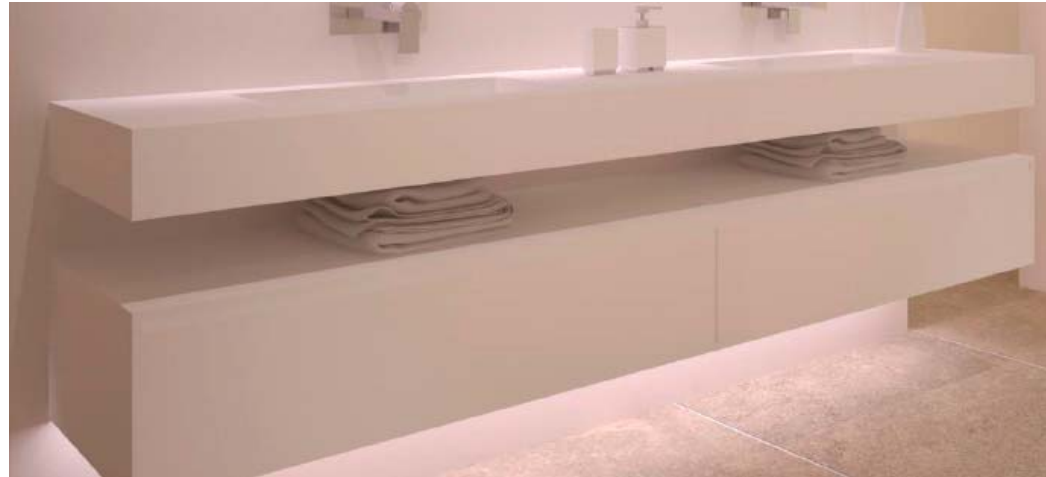
Composición baño principal