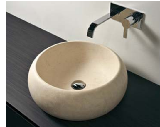
Lavabo en aseo

Encimeras en baños y aseo de planta baja en Corian con lavamanos integrado. Lavamanos doble en baño en suite en dormitorio principal. Lavamanos sobre encimera en aseo de planta baja.