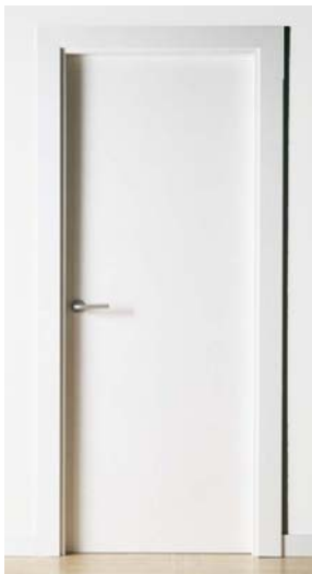
Puertas de paso

Nota: no se incluye el interior y puertas de armarios y vestidores, pero si las particiones exteriores que delimitan los armarios.