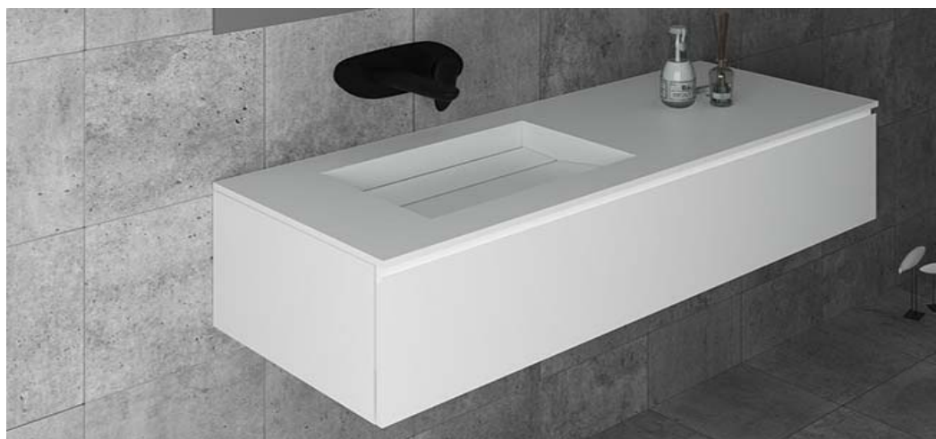
Composición baño secundario