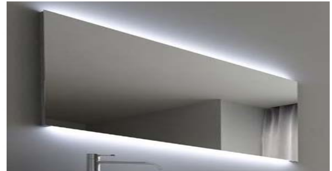
Espejo retriluminado baños